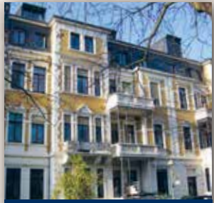
Poppelsdorfer Allee 50-52

+ Zentral im eleganten Bonner Zentrum gelegen